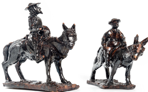
Quijote y Sancho , 1937 Pedro Mercedes

Actualmente su estilo pervive en Cuenca, en formas y técnica, junto a las últimas innovaciones derivadas de las nuevas tecnologías.