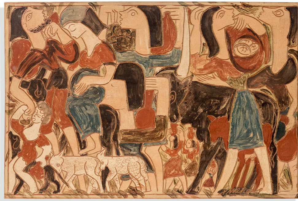
Pedro Mercedes. Éxodo , 1965.