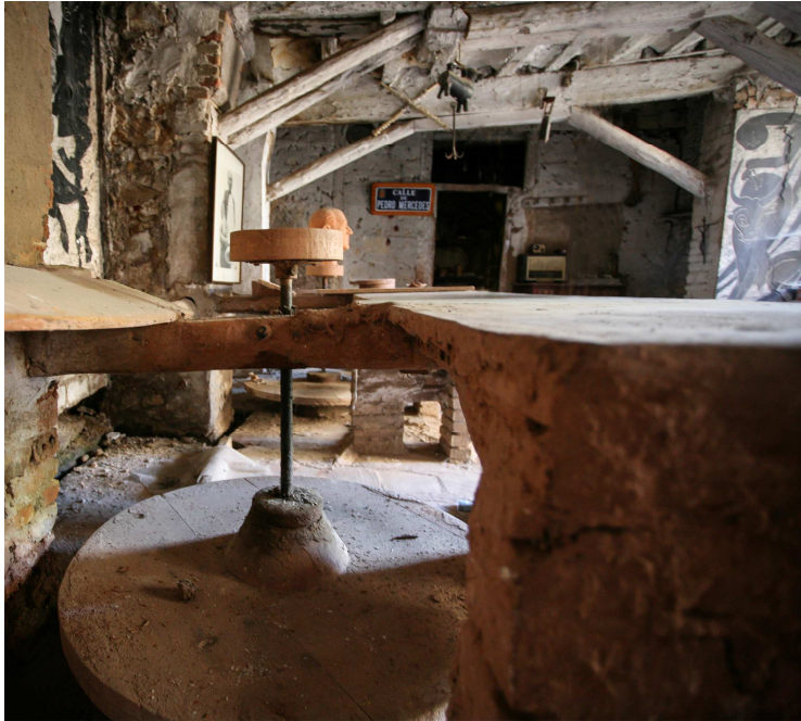
Alfar de Pedro Mercedes, Cuenca.