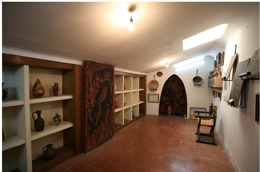
Alfar de Pedro Mercedes, Cuenca.