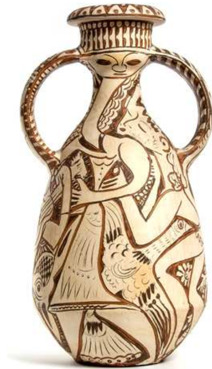
Pedro Mercedes. Fiesta , 1975.

En diciembre de 1987 cierra su horno, pero continúa su actividad artística realizando dibujos y grabados a buril con su estilo característico que utilizó en sus piezas en barro.